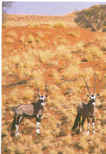
Couple d'oryx dans le Namib.

Quant aux mammifères, extraordinaires modèles d'adaptation aux conditions désertiques, leur existence est pratiquement partout menacée. Bétail sahélien, moutons et chèvres, dromadaires, exercent une forte compétition sur les herbages éphémères qui verdissent aux rares pluies