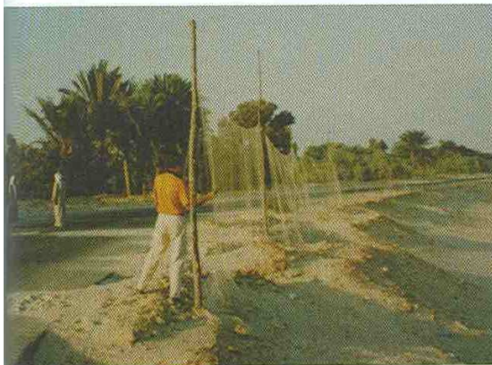
Tenderie de caille dans le Sinâï

La Fondation Internationale pour la Gestion de la Faune Sauvage (FIGF) a été créée en France en 1977 par le frère du Shah d'Iran. C'est une association loi 1901 reconnue d'utilité publique. Elle participe à la réhabilitation des populations de faune sauvage et de leurs habitats, en particulier des espèces gibier qui font l'objet d'un prélèvement par les chasseurs. Elle agit en association avec des sociétés de conservation de la nature, des administrations, des organismes interétatiques. Elle joue également un rôle d'expertise très apprécié auprès des gouvernements et lors de consultations internationales. FIGF, 15 rue de Téhéran 75008 Paris. Tél : 01 56 59 77 55. Mail : igf@fondation-igf.fr