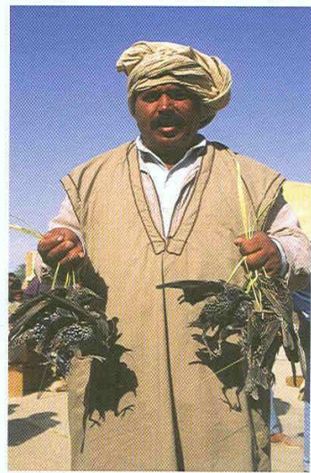
Vente d'étourneaux en Tunisie.

éparses. Les tribus du désert, les militaires, les groupes rebelles, les prospecteurs de pétrole, avec leurs véhicules tout terrain et les armes de guerre, ne laissent plus aucun répit au grand gibier. Là aussi une longue tradition !