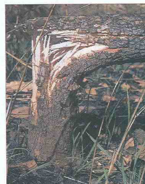
Les paysans victimes des dégâts causés par les éléphants sont exposés à des difficultés financières conséquentes.

texte Safauratou Alfa Gambari Imorou, ingénieur en environnement Cenagref