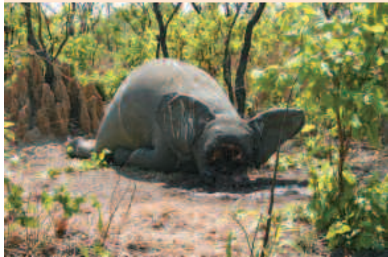
Éléphant braconné dans le nord de la République centrafricaine, en 2007.

Par ailleurs, même dans des conditions propices au comptage en avion, c'est-à-dire dans les paysages ouverts de savane ou de forêt claire, DOUGLAS-HAMILTON (1996) estime que seulement un tiers à un cinquième des éléphants morts sont effectivement vus, et que par conséquent on ne peut pas calculer de taux de mortalité par rapport à l'effectif vivant estimé.