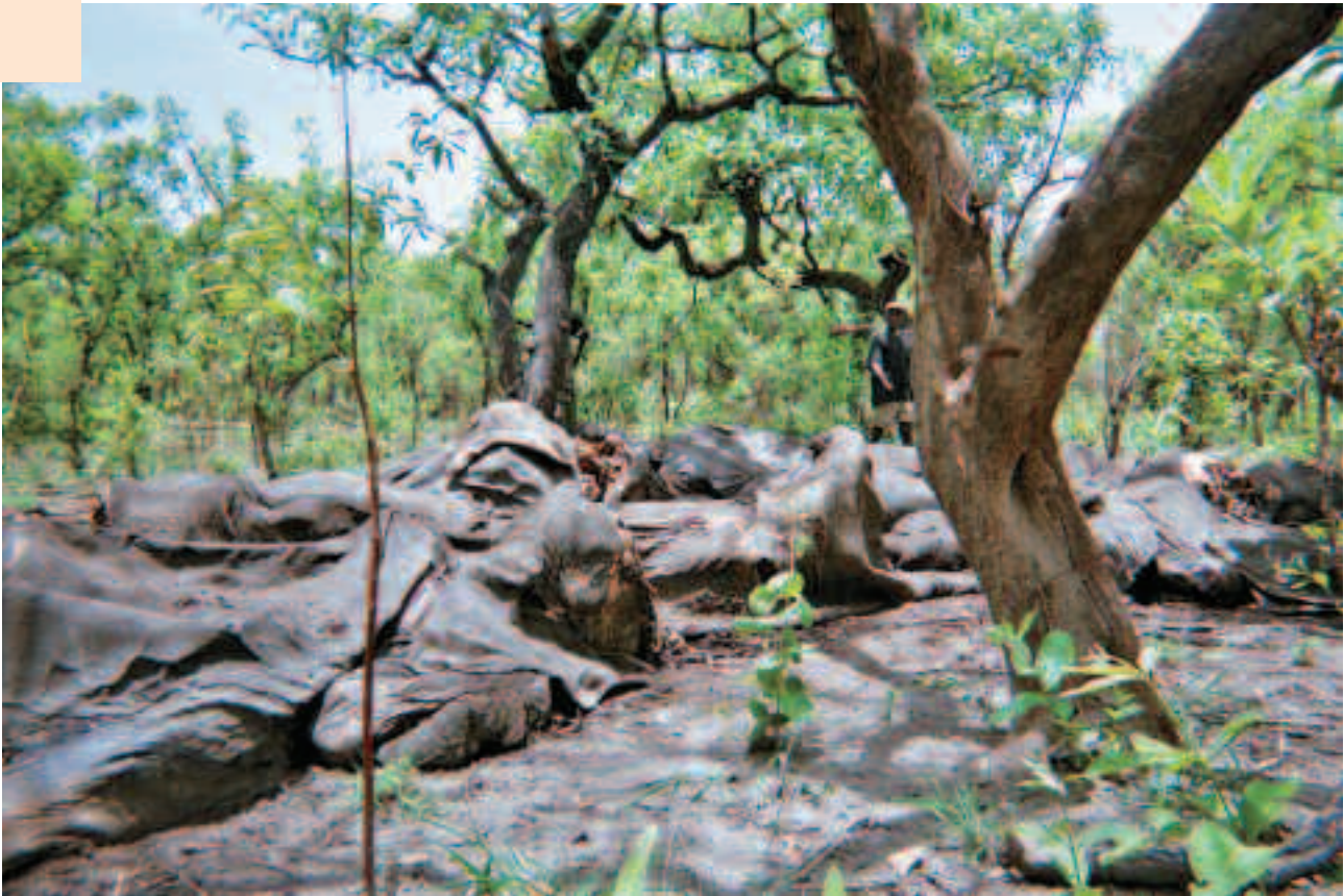
Famille entière d'éléphants abattus par les braconniers dans le nord de la République centrafricaine en 2007.