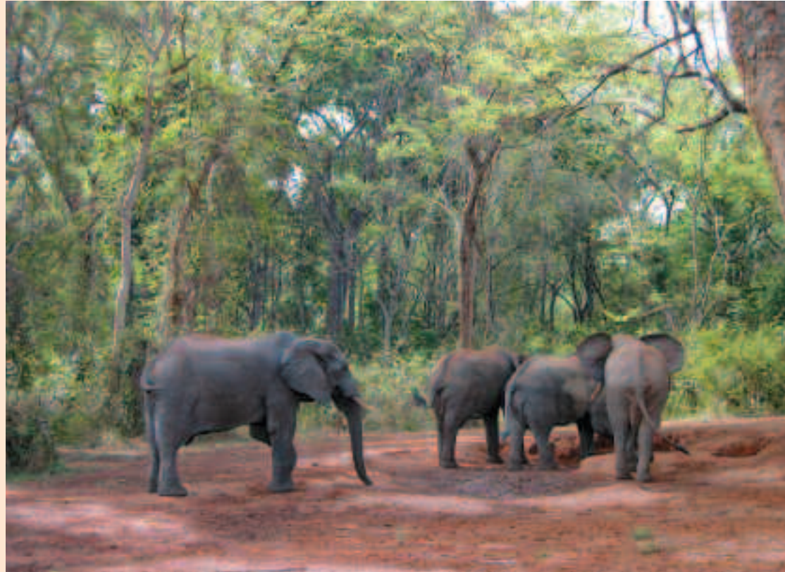
Éléphants dans la saline de Sangba, dans le nord de la République centrafricaine.

Fondation internationale pour la gestion de la faune (Fondation Igf) 15, rue de Téhéran 75008 Paris France