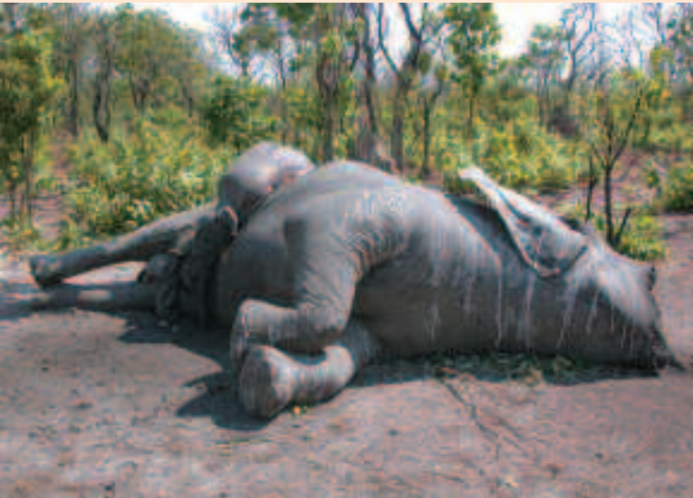
Éléphante adulte gestante, braconnée dans le nord de la République centrafricaine, en 2007.

La campagne de braconnage 2007 s'est achevée avec l'arrivée des pluies. En saison humide, les informations du terrain proviennent des équipes de personnels qui restent en place pour garder les campements et les zones gérées par les opérateurs touristiques. Les informateurs rapportent que des éléphants sont encore là, bien présents. Tous les éléphants n'ayant pas été abattus, le taux de braconnage est donc encore loin de 100 %. De ce fait, on peut s'attendre à une nouvelle campagne de braconnage en 2008.