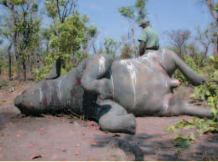
Éléphant braconné dans le nord de la République centrafricaine, en 2007.