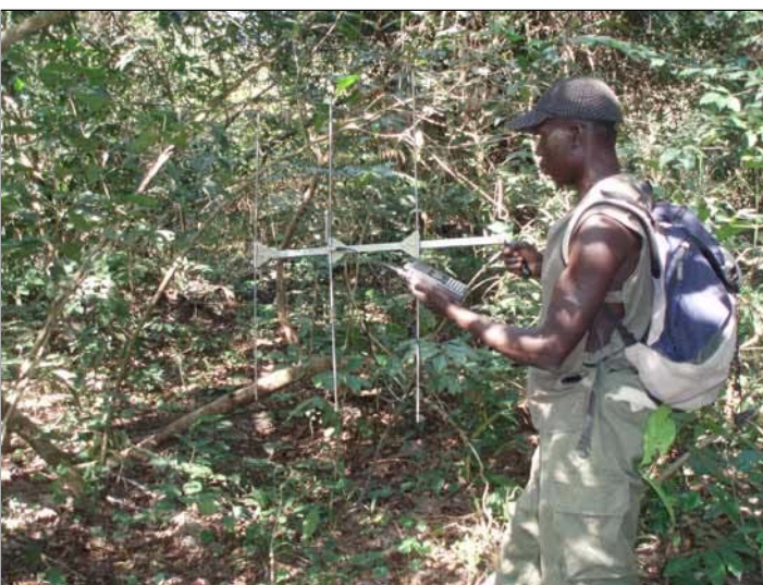
Désormais, il faut suivre l'animal. Et, dans son environnement, rien n'est gagné mais les équipes, à Paris, comme sur le terrain, sont à pied d'oeuvre.

Même si c'était la première fois que nous capturons un bongo, nous avons déjà l'expérience de nombreuses captures d'autres tragélaphes (la famille d'antilopes à laquelle appartient le bongo), les élands (du Cap et de Derby), le grand koudou, la guib harnaché. La capture s'est très bien passée. Le tir d'une deuxième flèche complémentaire est une intervention classique en matière de capture. L'animal s'est bien réveillé et nous avons pu nous assurer dans les jours suivants qu'il se déplaçait bien.