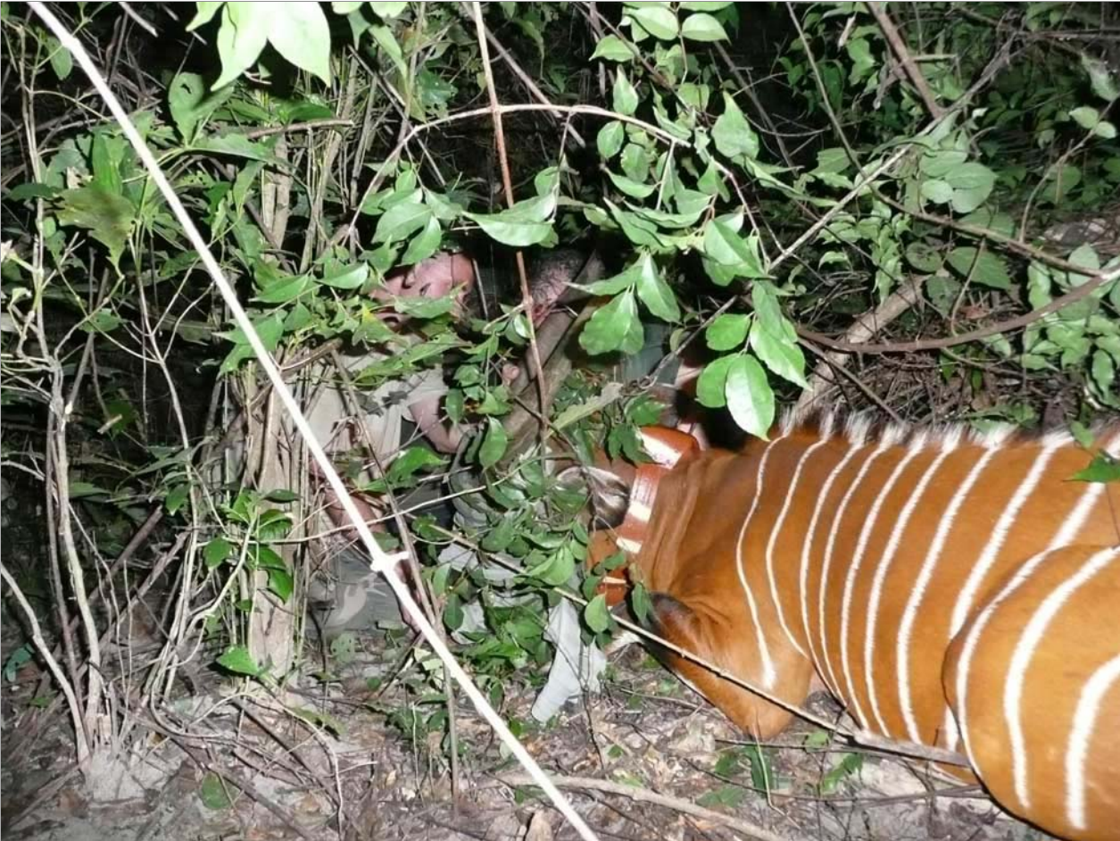
La nuit, la végétation, la fatigue malgré l'enthousiasme ne sont pas à négliger.

C.c. M. : Nous allons revenir, le mois prochain sur les premières analyses des déplacements de cet animal. Maintenant, la capture et la pose de ce collier n'ont il pas ou ne vont ils pas poser problèmes à cet animal ?