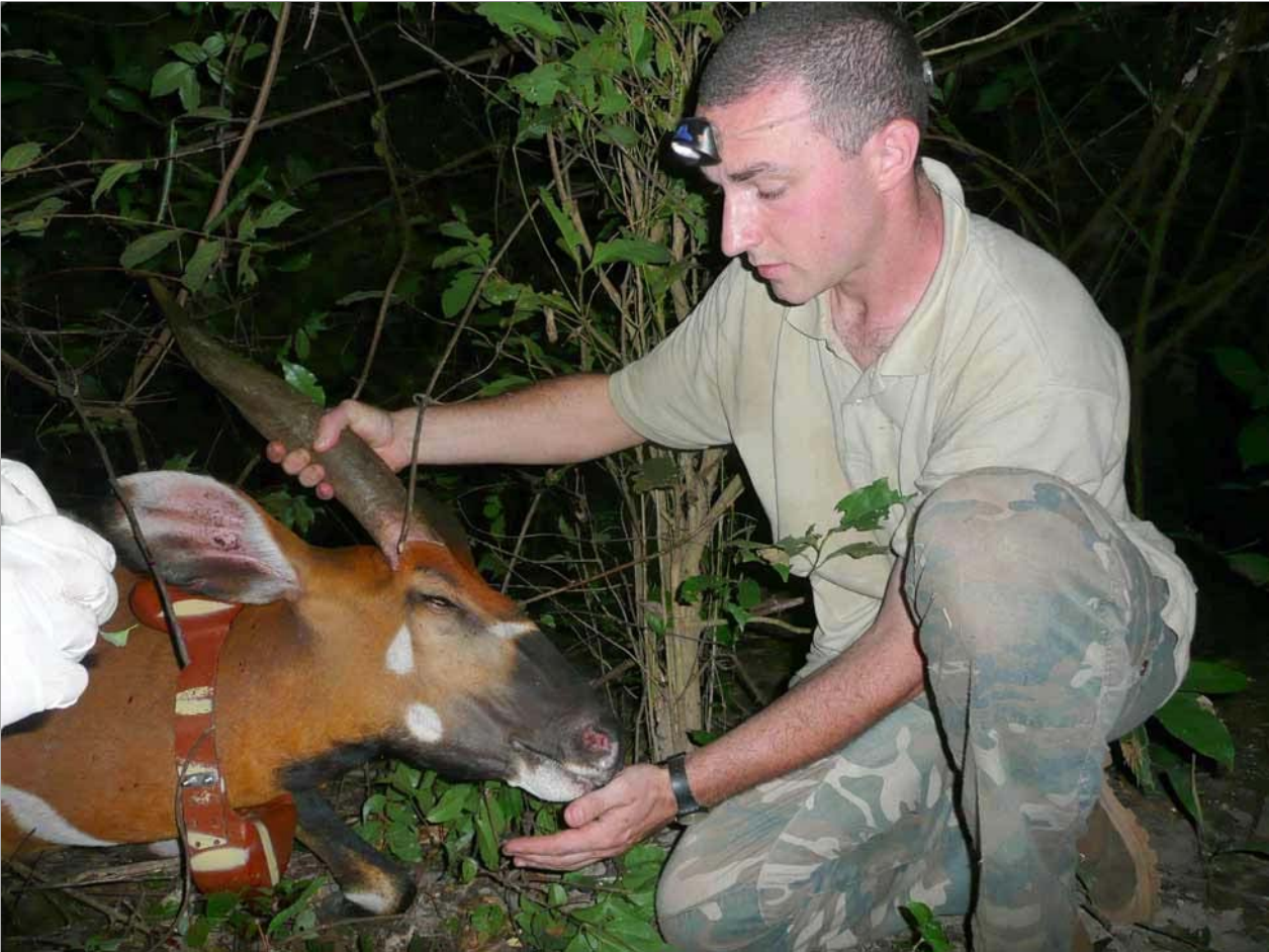
Pose du collier et premières analyses.