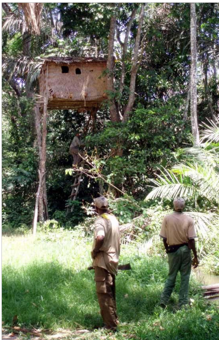
Création d'un affût spécifique.