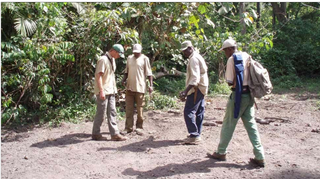
Recherche de traces sur les salines.

C'est pour pallier toutes ces carences de connaissance qu'a été entreprise cette étude sur le suivi écologique du bongo en République Centrafricaine.