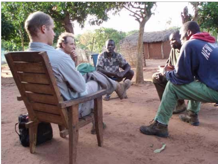
Rencontre avec les autorités locales.

Très peu d'études ont été conduites sur cette espèce à part celle de Hillman au Soudan dans les années 70 et celle de Elkan au Congo Brazzaville dans les années 90. En République Centrafricaine l'animal n'a été étudié qu'une fois dans la zone forestière de Dzangha par l'équipe de Klaus-Hügi, Klaus et Schmidt à la fin des années 90.