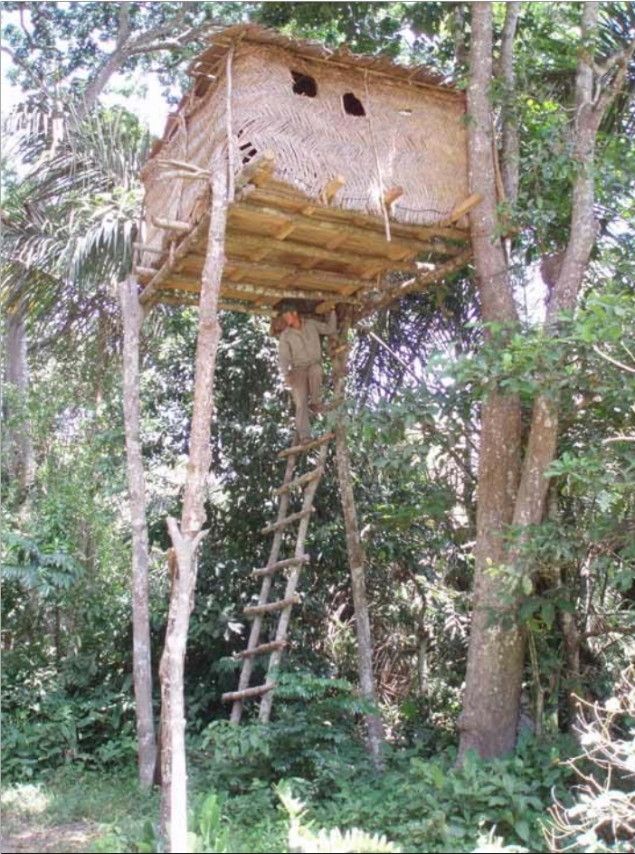
Opérationnel, l'affût doit maintenant faire ses preuves !