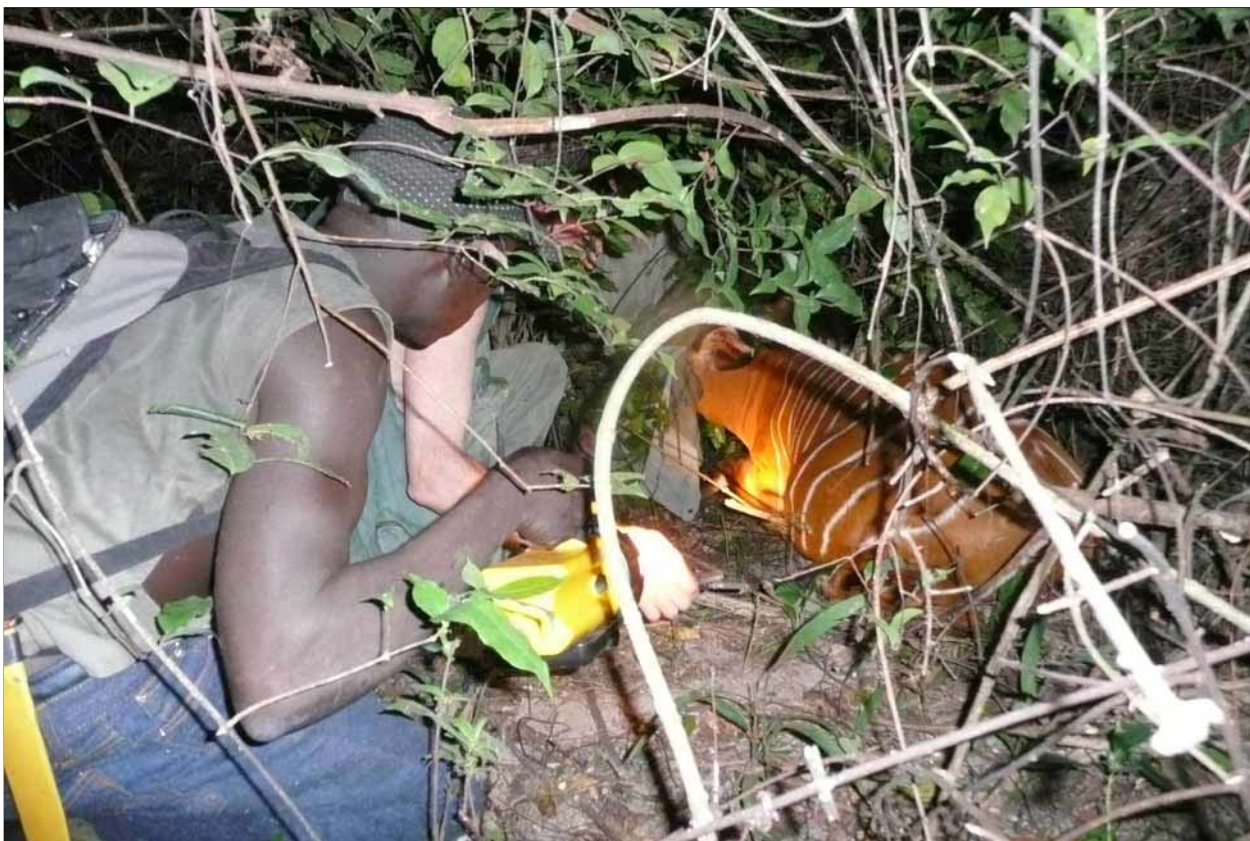
Le bongo a été fléché. Le retrouver dans les meilleures temps, de nuit, est une gageure !

D'abord, comme il s'agit d'une première, nous ne disposons pas de référence qui nous permette d'adopter un protocole anesthésique connu. Nous nous sommes basés sur les normes connues d'anesthésie du bongo en captivité dans les zoos en sachant que le protocole doit être adapté d'une part à l'espèce à l'état sauvage dans son milieu naturel, et d'autre part au poids vif de l'animal choisi qui varie considérablement selon l'âge et le sexe (le dimorphisme sexuel est important dans cette espèce).